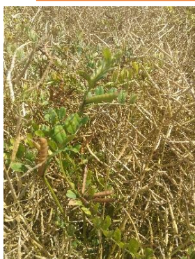
Figure 3 : essai Greenotec où la vesce n'a pas gelé

Nous avons testé l'application de 1,25 l d'herbicide contenant 200 g/l DIMETHENAMIDE-P ; 200 g/l METAZACHLORE ; 100 g/l QUINMERAC en levée précoce avec de bons résultats sur la sélectivité des légumineuses.